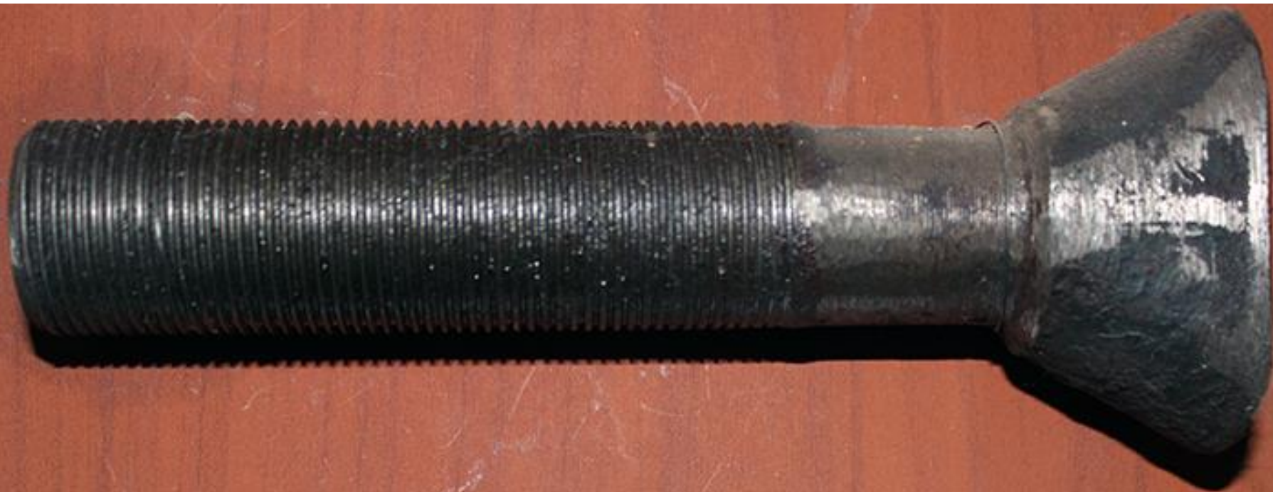
Болт М 30 * 2 крепления броневых плит сырьевых мельниц отделение сухого помола сырья ЗАО «Катавский цемент»