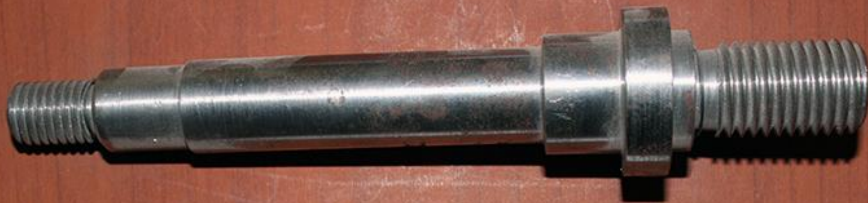
Палец соединительный с резьбами: М 20; М 14 (левая)