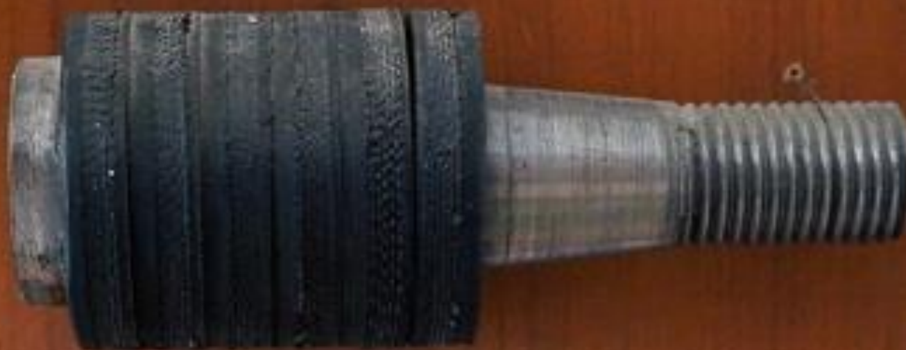
Болт М 30 с резиновым кольцом (основной дымосос) отделение обжига клинкера ЗАО «Катавский цемент»

Продукция, изготавливаемая в мастерских Катав-Ивановского индустриального техникума